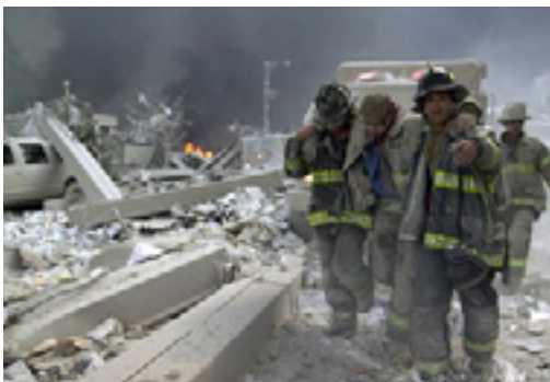
Imagen 3. Elementos del cuerpo de bomberos auxilian a un compañero herido durante los ataques del 11 de septiembre de 2001 en New York, EU.

Elementos del cuerpo de bomberos, un caballo de la policía montada y una patrulla, son elementos simbólicos por sí solos, sin embargo, posteriormente a los ataques del 9/11 y gracias a la mediatización, se han convertido en elementos discursivos del patriotismo estadounidense. La versión oficial sobre el ataque a las torres gemelas forma parte del discurso con el que se justifican las intervenciones e invasiones militares a territorios extranjeros por parte de los Estados Unidos. (Imagen 3 y 4).