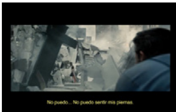
Imagen 8. Bruce Wayne observa a una pequeña niña y detrás de ella una estructura en forma de cruz emerge de entre los escombros del edificio colapsado. Captura de pantalla del film "Batman v Superman – Dawn of Justice"

Es pertinente resaltar en esta secuencia los diálogos que intercambia Bruce Wayne con dos de los personajes que se encuentran en una situación comprometida debido a los ataques. Durante su recorrido por la ciudad establece comunicación telefónica con uno de sus ejecutivos (Jack) quien se encuentra en el edificio que posteriormente colapsa, y a quien le da la instrucción de que el