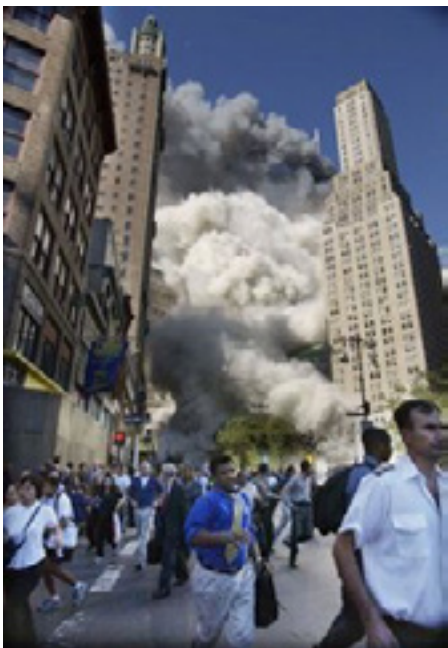
Imagen 5. La multitud evacúa la zona de los ataques mientras las torres se desploman en el fondo. 11 de septiembre de 2001. New York, EU.