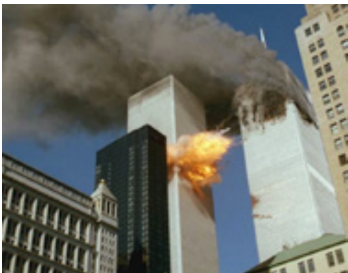
Imagen 1. Humo sale de una de las torres del World Trade Center; mientras la segunda explota en llamas durante los ataques del 11 de septiembre de 2001 en New York, EU.