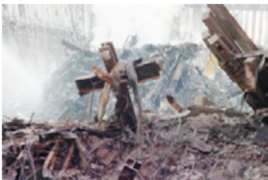
Imagen 7. La cruz que quedó entre los escombros del World Trade Center se ha convertido en un símbolo de esperanza para algunos y en un objeto de ofensa para otros, lo que ha originado una disputa legal al ser exhibida en el 9/11 Memorial & Museum de New York, EU.