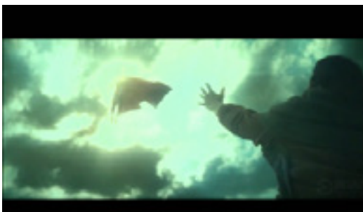
Imagen 9. Superman es presentado como figura salvadora descendiendo desde lo alto. El ángulo de toma contrapicado sugiere subordinación o sumisión ante lo que se observa. Captura de pantalla del film "Batman v Superman – Dawn of Justice" Derechos reservados Warner Bros.

Los diálogos de la segunda secuencia (el debate mediático en torno a la figura de Superman ) parece poner el foco en esta disputa. La desmitificación del héroe como deidad (Imagen 9), como ser omnipotente con un compromiso moral. La secuencia hace un recorrido ideológico cambiando la perspectiva sobre el personaje. La primera escena muestra a un ser por encima de la humanidad, pero en un contexto que no se asocia al de la sociedad que lo produce, pero que idolatra al personaje que los representa. Una fiesta ritual de una cultura que interpreta como subdesarrollada con atuendos rurales y que rinden culto a la muerte (Imagen 10). En el movimiento de cámara está implícito el cambio en la mirada. Al final de la secuencia, el dios queda destronado y debe asumir las consecuencias de sus actos, debe responder al poder del hombre y someterse a su autoridad. Quien lo juzga es una representante del gobierno estadounidense.