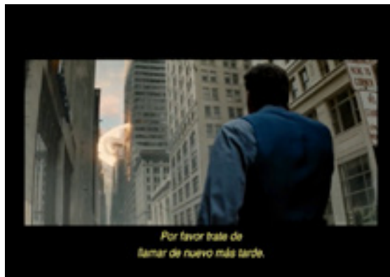
Imagen 2. Bruce Wayne observa cómo explota un edificio en Metrópolis durante la batalla entre Superman y el General Zod. Captura de pantalla del film "Batman v Superman – Dawn of justice".

Elementos del cuerpo de bomberos, un caballo de la policía montada y una patrulla, son elementos simbólicos por sí solos, sin embargo, posteriormente a los ataques del 9/11 y gracias a la mediatización, se han convertido en elementos discursivos del patriotismo estadounidense. La versión oficial sobre el ataque a las torres gemelas forma parte del discurso con el que se justifican las intervenciones e invasiones militares a territorios extranjeros por parte de los Estados Unidos. (Imagen 3 y 4).