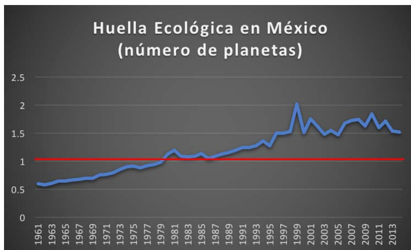
Ilustración 1: Huella Ecológica en México (número de planetas)

Elaboración propia con base en (Global Footprint Network, 2018)